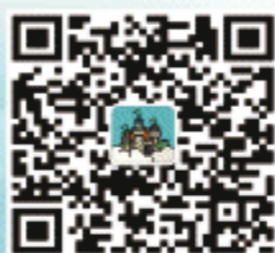
2016中考咨询会官方微信 权威招生信息一扫了知