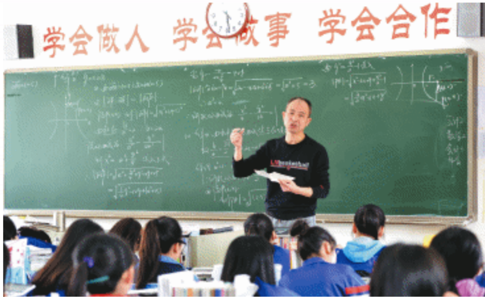
长沙财经学校从思想、纪律、学法等方面进行指导,帮助孩子重拾自信,圆大学梦。

多年来,长沙财经学校坚持职业培养和升学“两手抓”,满足不同层次学生、家长的要求,就业与升学并驾齐驱。学校成为中南地区现代服务业类技能型人才培养基地,累计为长沙社会经济发展培养高素质技能型人才4万多人,仅在长沙金融行业,就有151位银行行长、经理来自该校。在全省普通高校对口招生高考中也是一枝独秀,连年夺得骄人成绩。一组数据显示,该校近三年高考二本以上上线人数出现快速增长,2014年为142人,2015年为179人,2016年上升到185人。该校连续十三年蝉联财会类、连续九年蝉联商贸类、连续三年蝉联文秘类高考第一名。